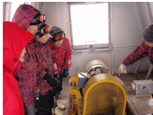
第2 パアリフト操作点検作訓練

（2）営業運行前に始業点検・試運転を実施してお客様の安全が確保できることを確認してから営業運行に入りました。