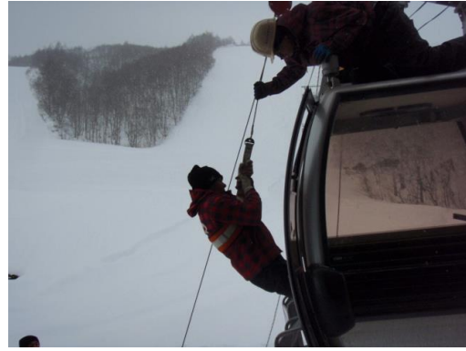
第2 ゴンドラ救助訓練