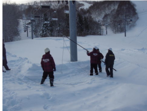
第2ペアリフト救助訓練