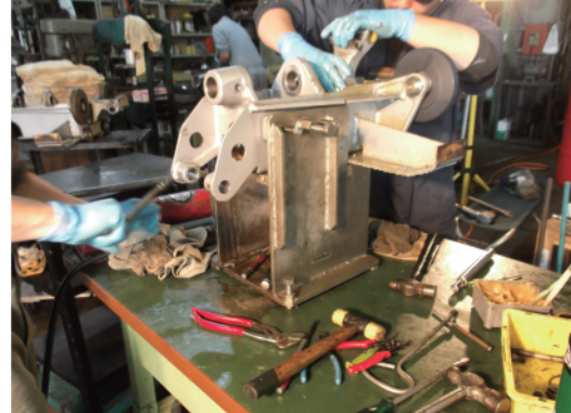
握索装置の分解整備