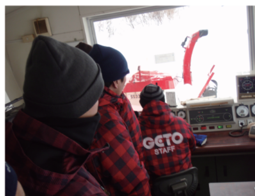
第2ペアリフト操作点検作訓練

（2）営業運行前に始業点検・試運転を実施してお客様の安全が確保できることを確認してから営業運行に入りました。